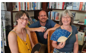
Buchhandlung Hübener Bremerhaven