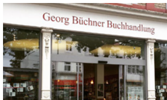
Georg Büchner Buchhandlung